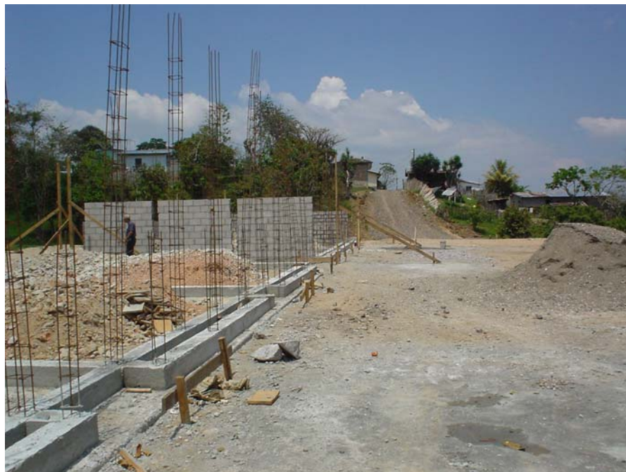
Figura 2, Levantamiento de la obra: Escuela Francisco Morazán, Aldea La Esperanza