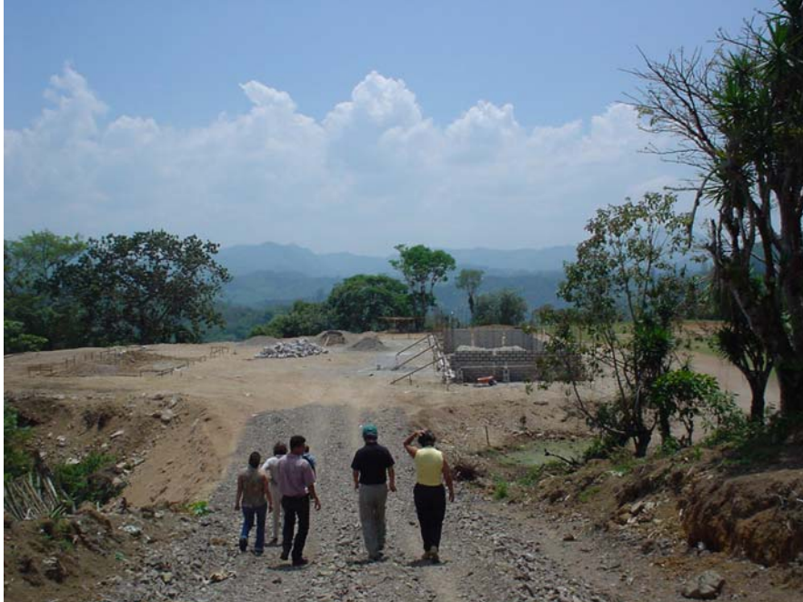
Figura 1 Personal municipal, cooperación, comunidad, supervisando la construcción de la escuela