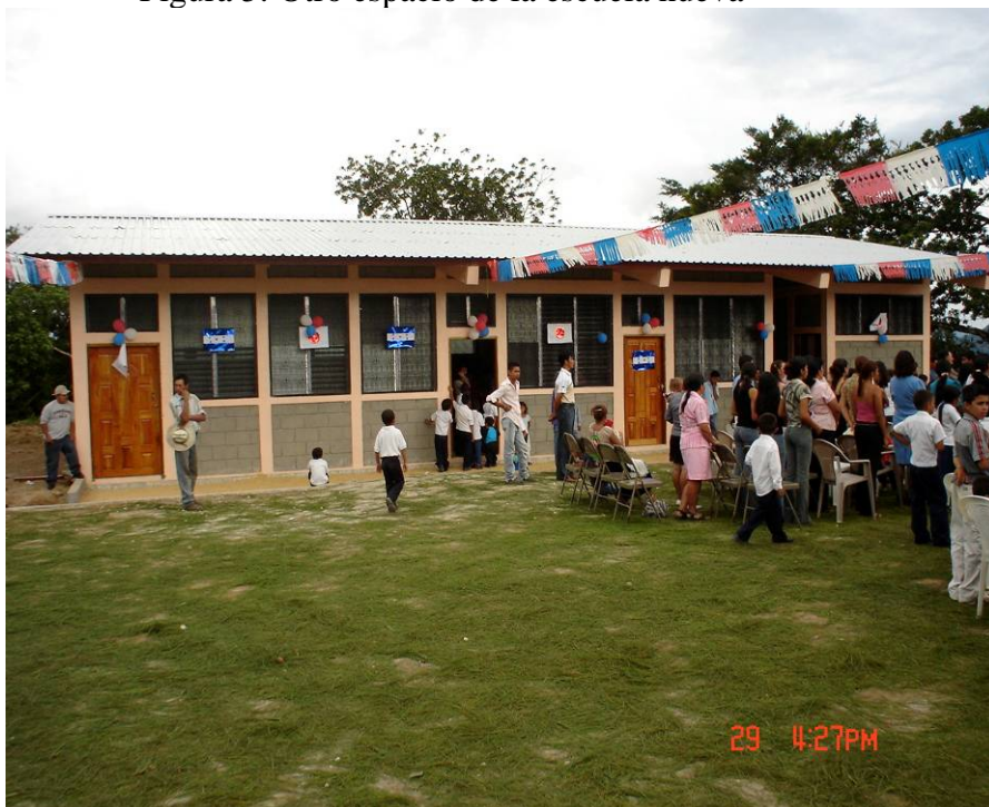
Figura 5: Otro espacio de la escuela nueva